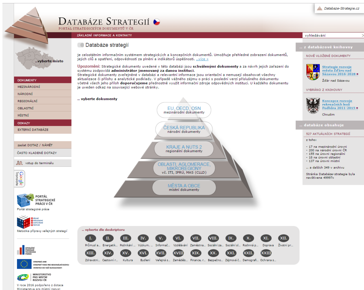
Obr. 1 Příklad vizualizace Databáze strategií

Pro municipální úroveň existuje MMR vytvořený nástroj zaměřený na strategický rozvoj obcí – Elektronická metodická podpora rozvojových dokumentů obcí a Řízení rozvoje obcí. Aplikace (=ObcePro), která umožňuje tvorbu místních strategií, byla vytvořena na základě příslušných metodik a dobré praxe ( http://www.obcepro.cz/ ).